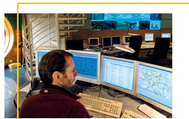
LES PRÉVISIONS BISON FUTÉ

Le cœur de métier de Bison futé est la prévision de trafic sur le réseau routier national en vue des déplacements de longue ou moyenne distance, notamment pendant les congés scolaires et autour des jours fériés. Le calendrier, qui donne les prévisions pour l'ensemble de l'année à venir, est complété par une trentaine de prévisions détaillées par an, disponibles quelques jours avant la période concernée. Elles précisent notamment les axes qui seront sous tension, les horaires à éviter, les chantiers éventuellement prévus sur ces axes et pouvant générer des ralentissements.