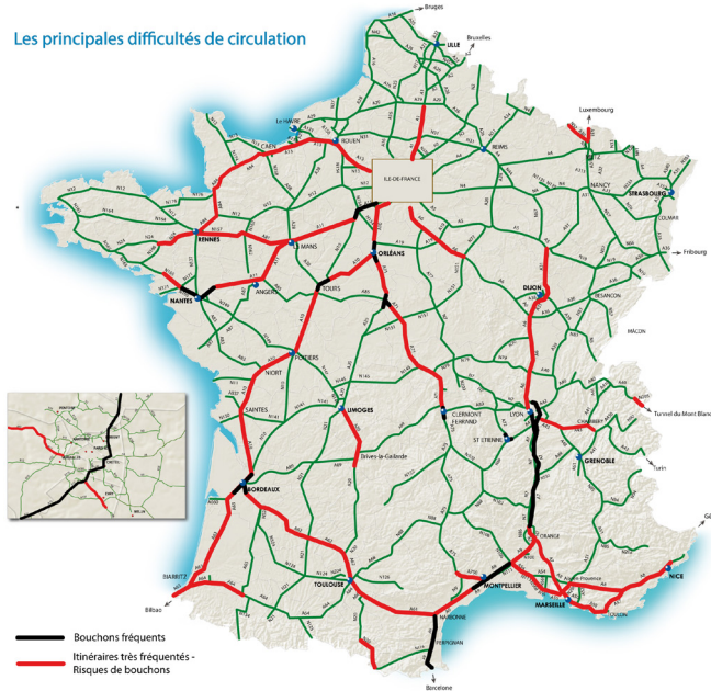
Les principales difficultés de circulation