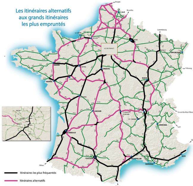
Les itinéraires alternatifs aux grands itinéraires les plus empruntés